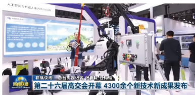
央视新闻报道第二十六届中国国际高新技术成果交易会盛况